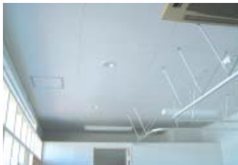
1 やわらかな光が差し込む治療室。受付のカウンターも白木の腰板が貼られています。天井もモイスを使用しています。